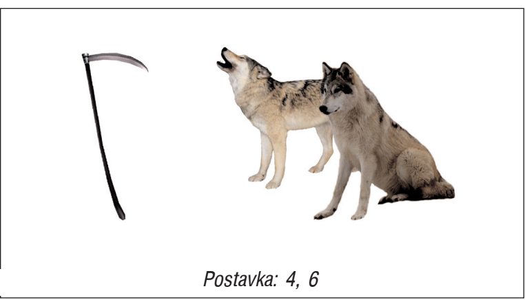
Postavka: 4, 6