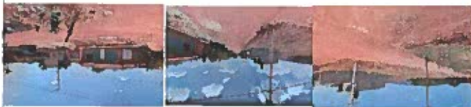
Foto lateral izquierda.- se tomará la foto de frente al lado izquierdo aproximadamente a 45 grados procurando que se abarque todo proyecto.

Foto lateral derecho.- se tomará la foto de frente al lado derecho aproximadamente a 45 grados procurando que se abarque todo proyecto.