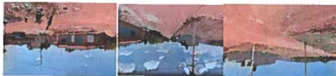
Foto lateral izquierda.- se tomara la foto de frente al lado izquierdo aproximadamente a 45 grados procurando que se abarque todo proyecto. Foto lateral derecho.- se tomara la foto de frente al lado derecho aproximadamente a 45 grados procurando que se abarque todo proyecto. Foto Frontal.- se tomara de frente procurando que se abarque todo proyecto.